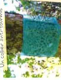
Un collier anti-fourmis

Par exemple : pièges mécaniques à taupe ou à limace, voiles anti-insecte, filets de protection contre les oiseaux ou sur les cultures du potager, colliers empêchant les fourmis de remonter le long des troncs.