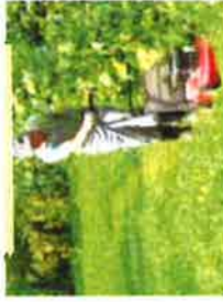
Le tonte haute

Californie et bourrache par exemple) se développer dans les allées gravillonnées ou en terre battue et entre les pavés. Elles prendront la place des herbes indésirables.