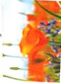
Des fleurs végabondes

Californie et bourrache par exemple) se développer dans les allées gravillonnées ou en terre battue et entre les pavés. Elles prendront la place des herbes indésirables.